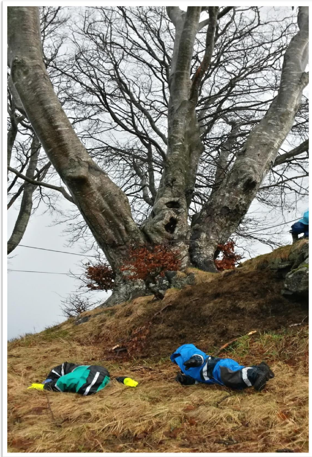
Figur 1: Rulle på Kongshaugen - motorisk stimulering av balanse- og likevektsans.