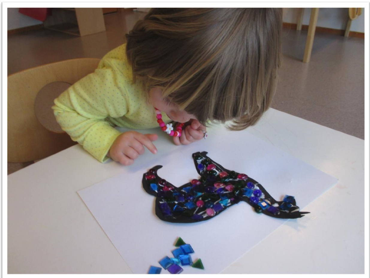
Figur 5: Bruse gjenskapes i mosaikk