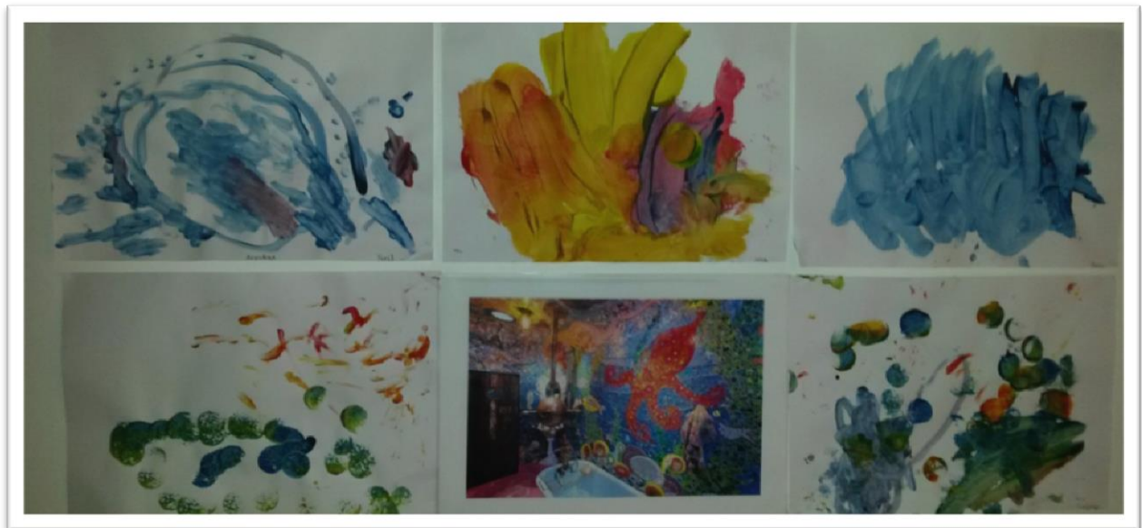
Figur 2: Kreativitet og Glede setter spor. På småbarnsavdeling mars 2015

Avdelingene nede kan fortsatt benyttes, men ikke med samme belastning som i dag. Vi ser kanskje for oss et drama/musikk/motorikk-rom på Bølgen og et verksted/førskole-rom på Strålen.