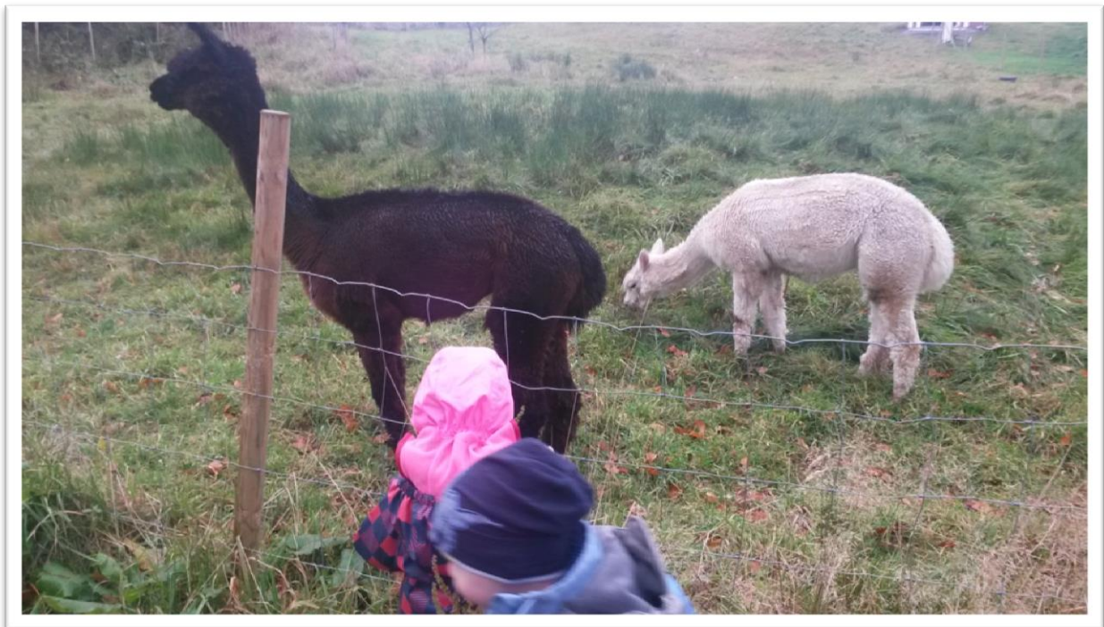
Figur 4: Vi besøker Perle og Bruse på Alpakka-gården